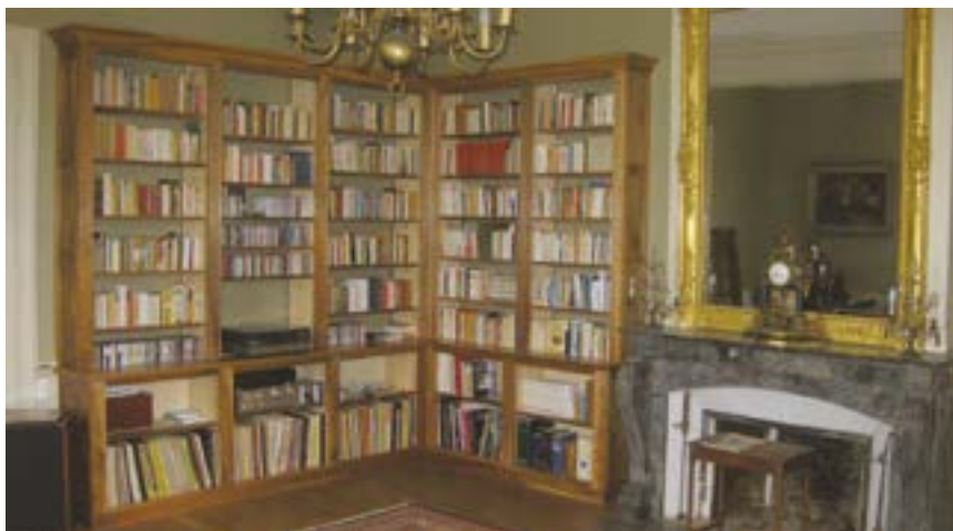
Création de bibliothèques anciennes et modernes

Enfin les vastes locaux de la Guitonnière accueillent régulièrement des stagiaires qui veulent découvrir l'ébénisterie d'art, à titre professionnel ou pour le loisir des « amoureux du bois ». Ce sont des formations à la carte journée/semaine, limitées à un petit nombre pour permettre un suivi personnalisé.