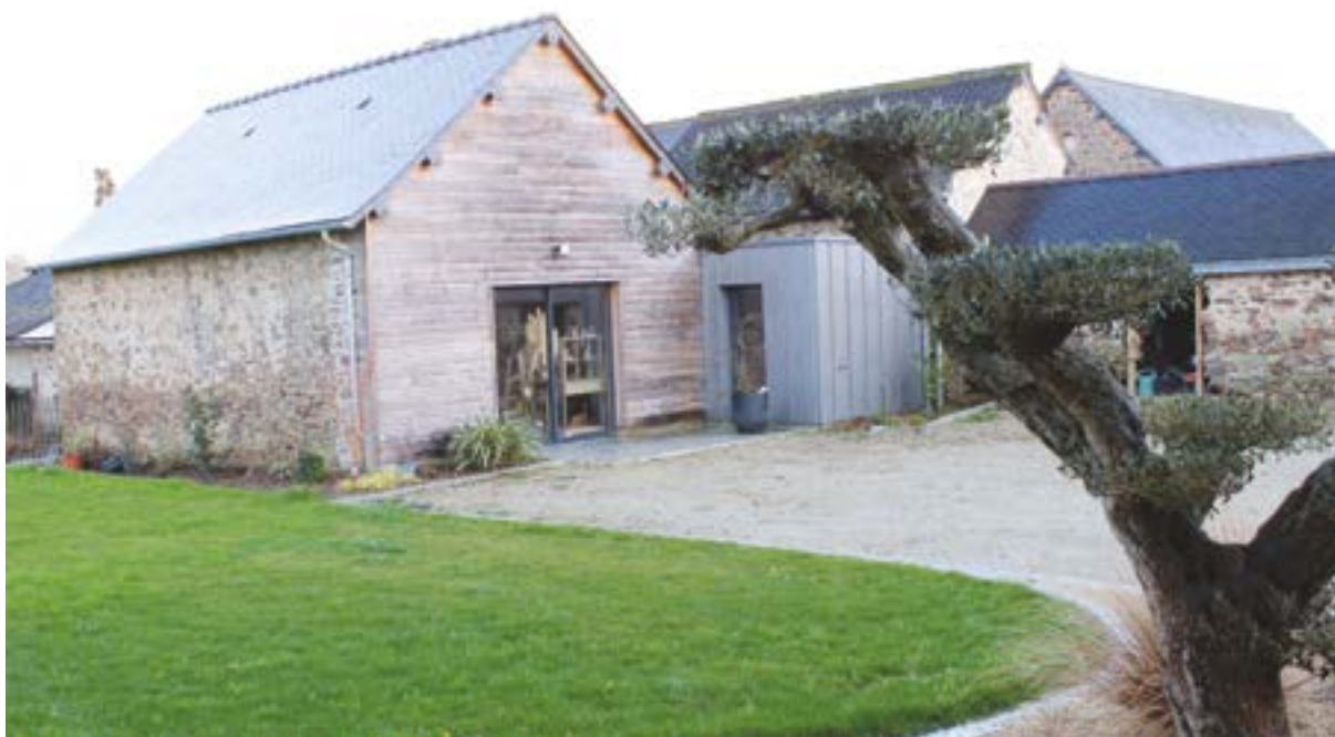
Le « showroom » de « Décor en fête » à la Tesserie